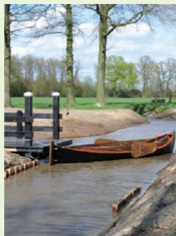
Dankzij de Leader bijdrage zijn de haven, aanlegsteiger en de zomp bij Museumboerderij de Pothaar in Bathmen in ere hersteld. De boerderij fungeerde vroeger als herberg voor schippers die over de Schipbeek vanuit Duitsland naar de Hanzestad Deventer voeren.